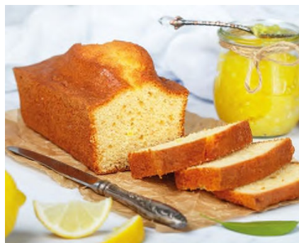
Pâtisserie sans gluten