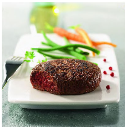
Viande & poisson